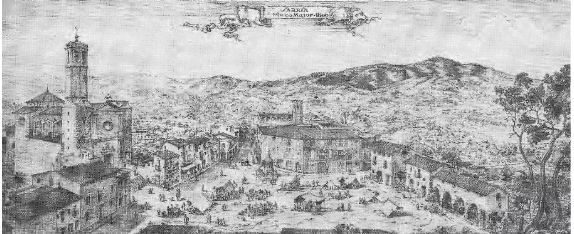
Sarrià 1800. Il·lustració de Pere Queraltó. La Veu de Sarrià, 28 de setembre 1989