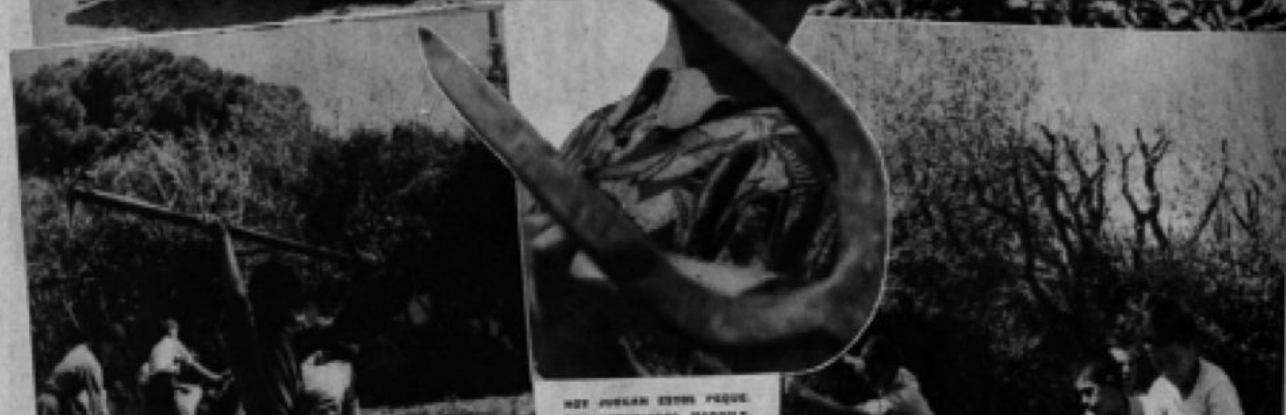
MEY JONGAN ESTOS PEQUE F'P'P'P'P'P'