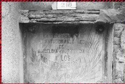
Lapidà commemorativa de "Màrtirs de la República" al Cementiri de Sarrià / Lapidà commemorativa a los "Màrtirs de la República" en el cementeri de Sarrià / Commemorative inscription to the "Martyrs of the Republic" in Sarrià Cemetery. AonA

El Ayuntamiento de Barcelona, con motivo del 150º aniversario de la Primera República, quiere recordar estos hechos y a los habitantes de Sarrià que tomaron parte en la insurrección.